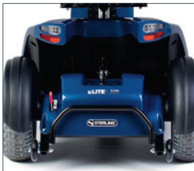
Suspensión trasera ajustable, guardabarros, ruedas antivuelco y parachoques trasero de serie.