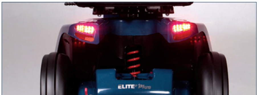
Elite 2 Plus ofrece unos resultados de conducción inmejorables gracias a su avanzado sistema de suspensión, que permite un movimiento de hasta 85 mm en la suspensión trasera y 50 mm en la delantera.