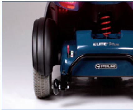
Guardabarros, ruedas antivuelco y parachoques trasero de serie.