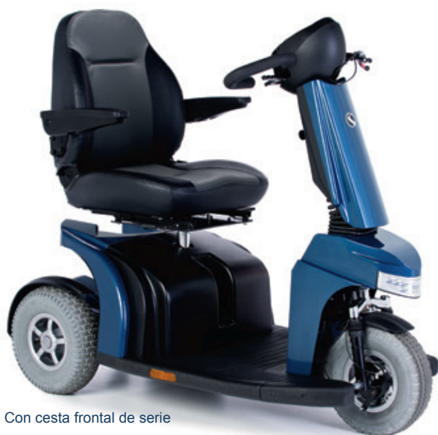
Con cesta frontal de serie