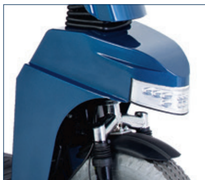
Visibilidad garantizada gracias a las luces de LED; luces delanteras y traseras, indicadores y luces de frenado.

Con asiento acolchado de gran calidad y múltiples ajustes para que el usuario pueda encontrar en todo momento la posición que le resulte más cómoda.