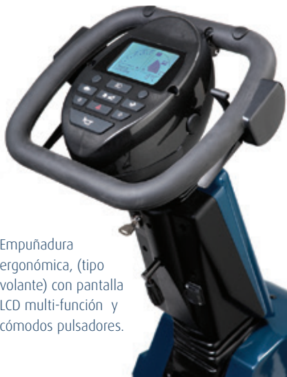
Empuñadura ergonómica, (tipo volante) con pantalla LCD multi-función y cómodos pulsadores.