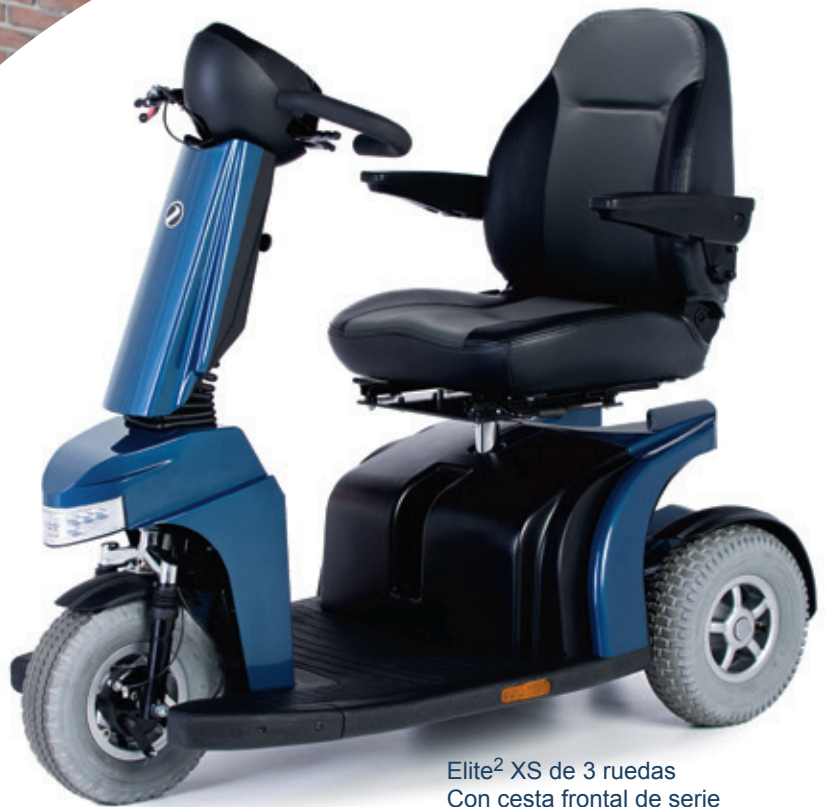
Elite 2 XS de 3 ruedas Con cesta frontal de serie

Confort, velocidad y rendimiento en exteriores