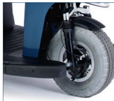
Ruedas delanteras de 13" con amortiguación delantera para una conducción más cómoda.