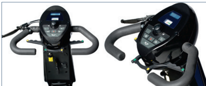
Amplias empuñaduras ergonómicas y palanca de control manejable con un dedo. Manillar ajustable en ángulo para asegurar el confort y una buena postura durante la conducción.