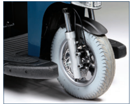
Ruedas grandes de 14" con llanta de aluminio y alto perfil para incrementar la tracción. Amortiguación delantera y frenos de disco.