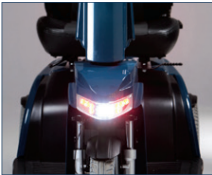
Visibilidad garantizada gracias a las luces de LED; luces delanteras y traseras, indicadores y luces de frenado.

A través de los botones del cuadro puede controlar los perfiles de conducción (interiores/exteriores), las luces y los indicadores.