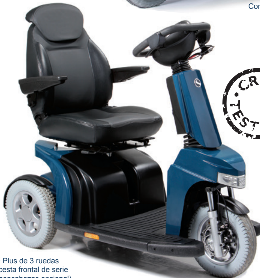
Elite 2 Plus de 3 ruedas Con cesta frontal de serie (Reposacabezas opcional)