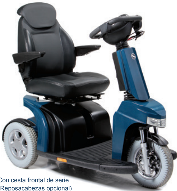
Con cesta frontal de serie (Reposacabezas opcional)