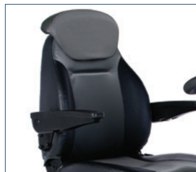
Asiento acolchado, giratorio 360°, ajustable y con soporte lateral lumbar. Extensión de respaldo opcional.