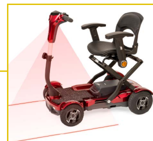
El laser indica el espacio de seguridad necesario para circular.