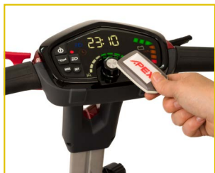
Pantalla multifunción y llave de proximidad