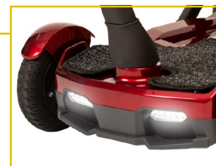
Luces LED delanteras y traseras.