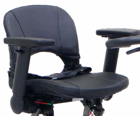
Cinturón de seguridad