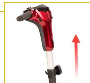
Manillar ergonómico y regulable en altura