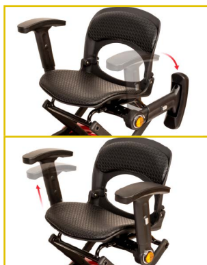
Reposabrazos abatibles y regulables en altura y anchura.