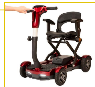
Botón de plegado de fácil acceso.