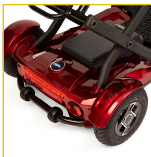
Ruedas neumáticas y antivuelco