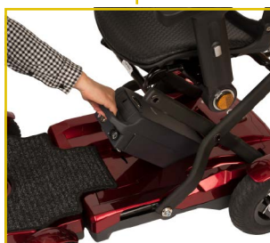
Batería de litio extraíble (14,5 Ah) para facilitar su carga.