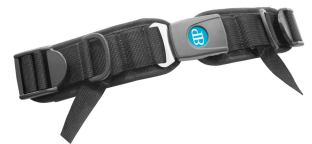
Cinturín pélvico 4 puntos Bodypoint