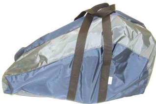
Bolsa transporte Zip