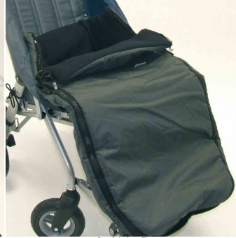
Saco de invierno Zip