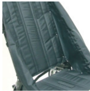
Tapizado nylon gris