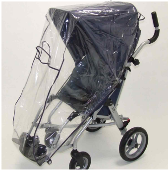
Capota con capa impermeable Zip