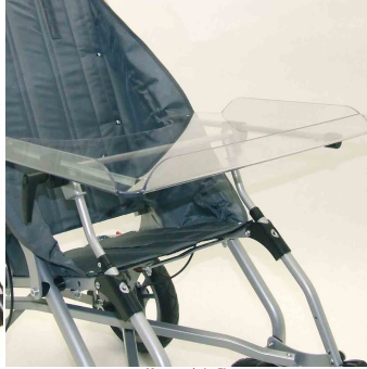
Mesa terapéutica Zip