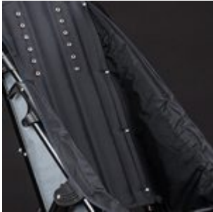
Tapizado nylon negro