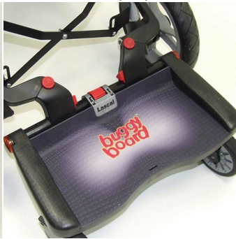
Buggy Board Zip