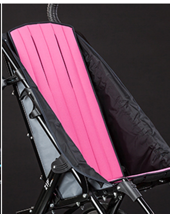
Tapizado asiento confort Zip