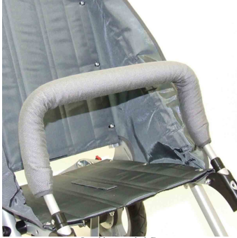
Barra delantera con funda Zip