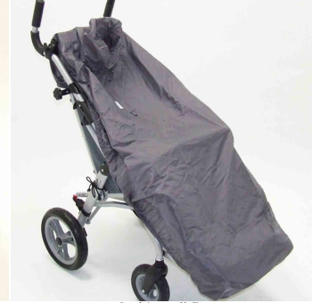
Capa de impermeable Zip