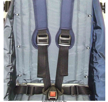
Cinturón 2 puntos Zip

REHAGIRONA Taco abductor abatible y extraíble Zip