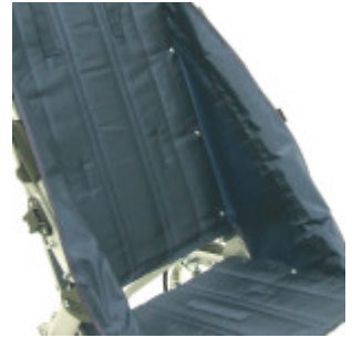
Tapizado nylon azul marino