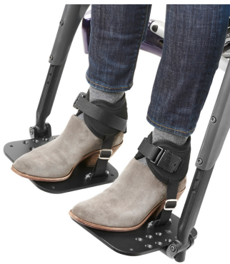
Cinchas de tobillo Ankle Huggers Bodypoint