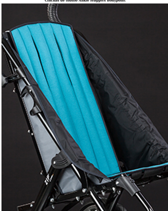
Tapizado respaldó confort Zip