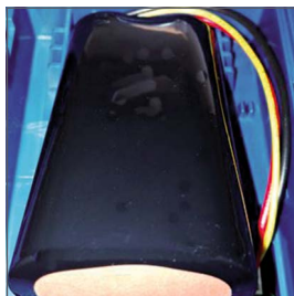
Batería de litio de larga duración que permite utilizarlo con una autonomía de hasta 12 horas.