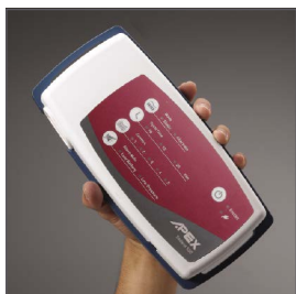
Compresor compacto, de fácil uso y silencioso.