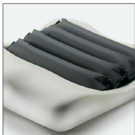
Compuesto de cuatro celdas de aire de presión alternante sobre una base.

Incorpora una funda bi-elástica que reduce la fricción. Es resistente al agua y fácil de lavar.