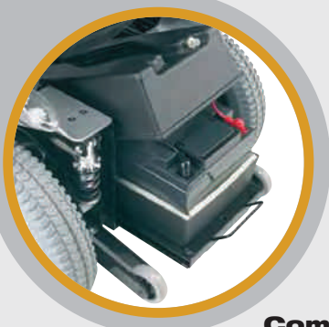
Compartimento de batería fácilmente extraíble