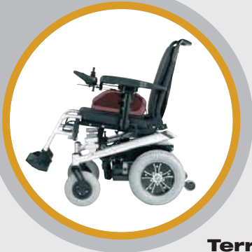
Terra con iluminación apta para exteriores