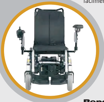
Reposabrazos con regulación lateral y de altura, desmontables para una transferencia lateral sin barreras