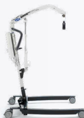
Birdie EVO COMPACT